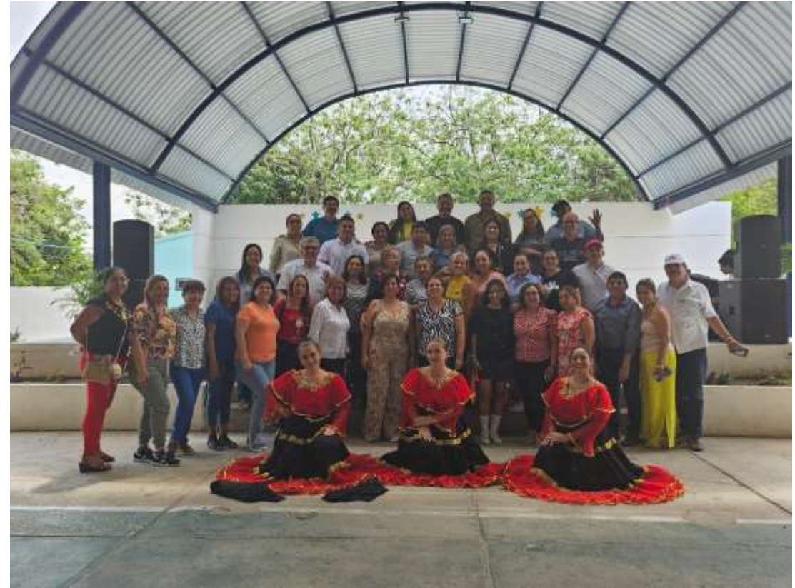
Participación en actividad de experiencias pedagógicas en el instituto Humbolt Barranquilla