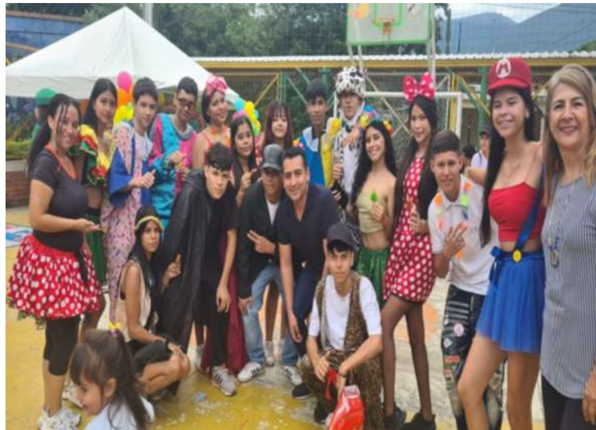
Vinculación con la Alcaldía de Los Patios apoyo en Recreación