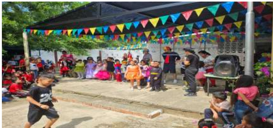
Recreación Instituto Educativo El Carmen de Belén