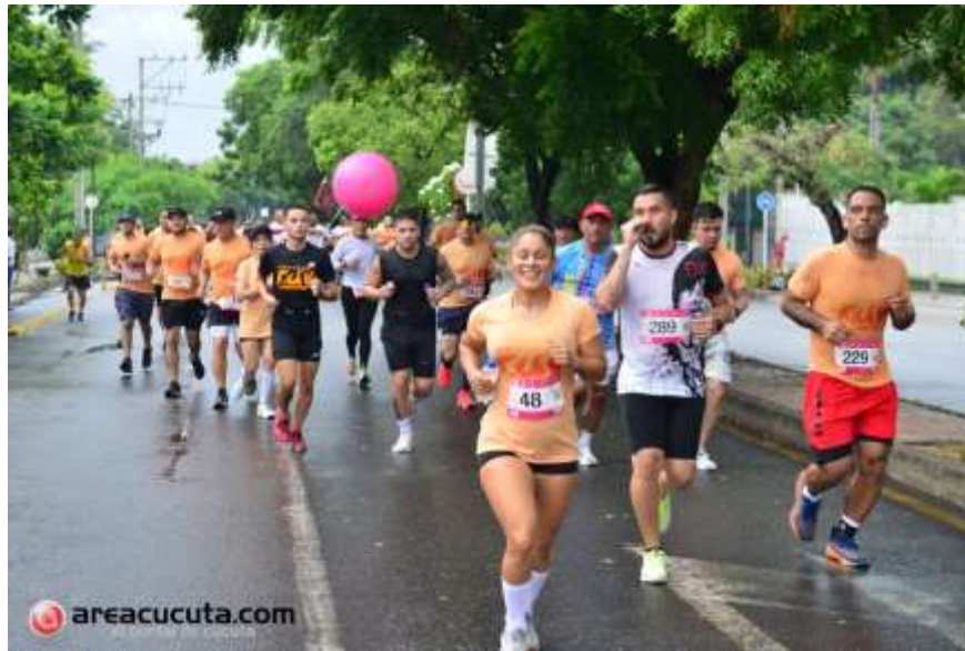
Renovación del convenio con Centro Comercial Ventura Plaza