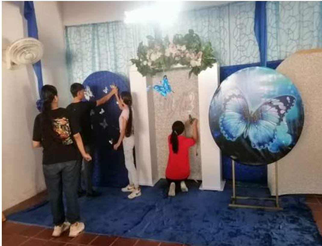
Stand de la feria empresarial Colmabrija 2023