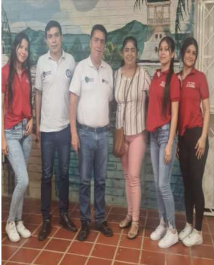
Actividades pedagógicas con entidades departamentales