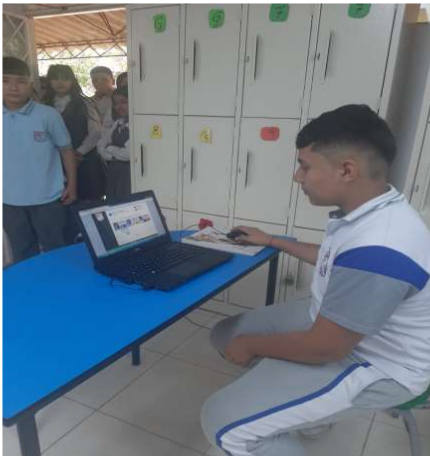
Votaciones Personero 2023